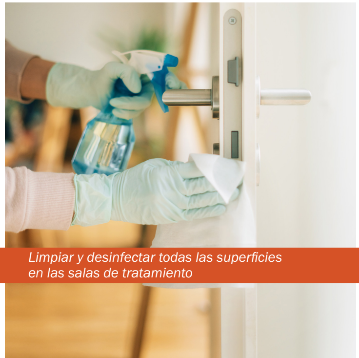
Limpiar y desinfectar todas las superficies en las salas de tratamiento