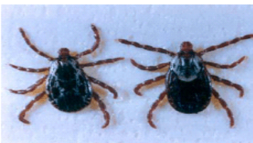
Garrapatas de perro Americano: Macho & Hembra