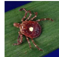
Garrapatas de Venado