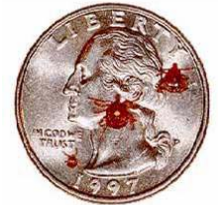
Deer ticks en una moneda de 25 centavos